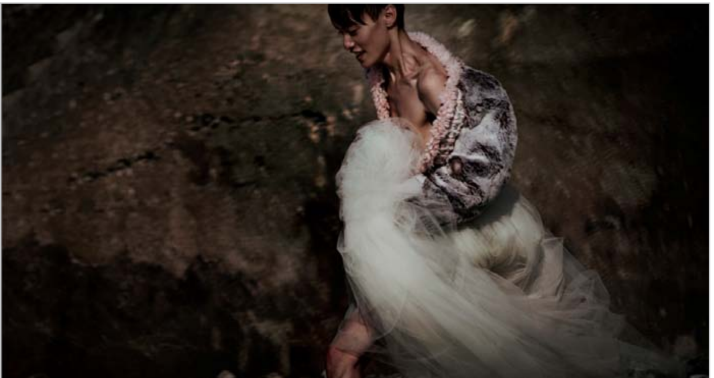
Imagen colección 'Guess Technology isn't Reddy for pancake teleportation' by Niels Peeraer.