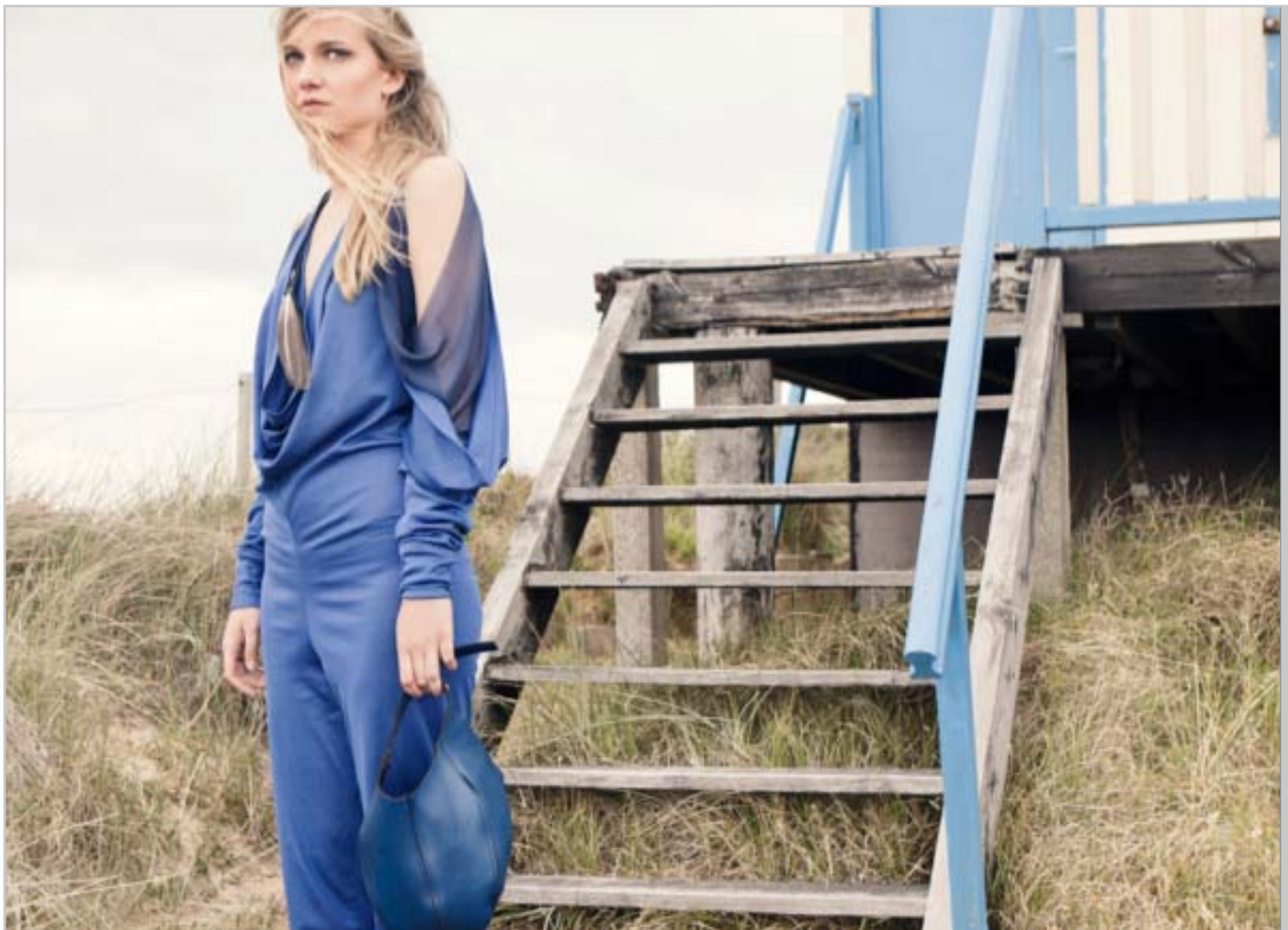
Imagen colección ‘On the Road’ by Hannah Jacobs.